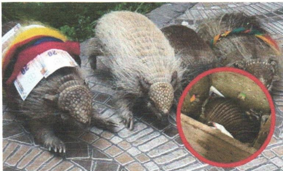
EL QUIRQUINCHO ANDINO BOLIVIANO EN PELIGRO DE EXTINCIÓN

En consecuencia, el quirquincho especie de nuestra fauna silvestre y parte de nuestra rica biodiversidad, que es nuestra obligación protegerla y salvaguardarla por ser un símbolo cultural ancestral de Bolivia, por tal razón justifico y solicito se pueda promulgar el presente PROYECTO LEY NACIONAL "DECLÁRESE AL QUIRQUINCHO ANDINO PATRIMONIO NATURAL Y CULTURAL DEL ESTADO BOLIVIANO, Y CELÉBRESE EL 26 DE JULIO DE CADA AÑO "DÍA DEL QUIRQUINCHO ANDINO" ESPECIE AMENAZADA EN PELIGRO DE EXTINCIÓN EN EL ALTIPLANO BOLIVIANO"