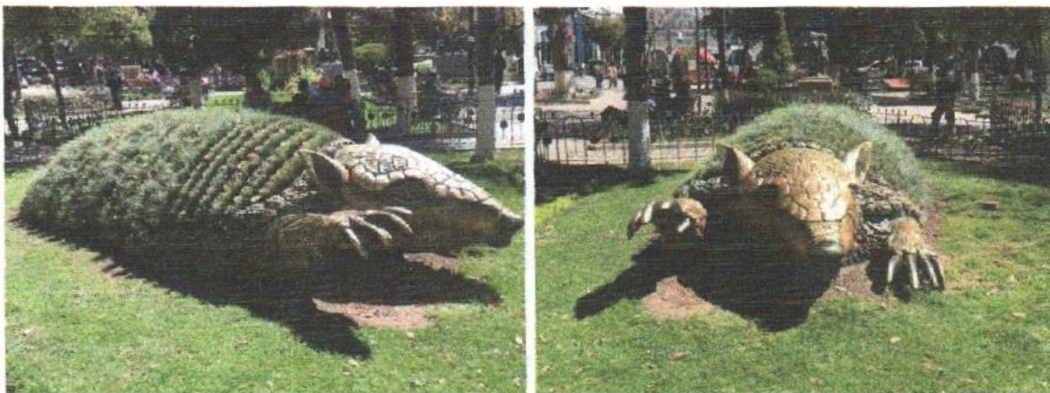
EL QUIRQUINCHO SÍMBOLO EMBLEMÁTICO DEL ORUREÑO

El Quirquincho Andino es el único que ha logrado adaptarse a la vida en la altura boliviana, su rango de distribución es estrictamente alto andina, habitando en áreas abiertas con condiciones arenosas y semi desérticas. El altiplano Boliviano se constituye como localidad tipo de esta especie, razón por la cual este animalito es considerado símbolo emblemático del Departamento de Oruro.