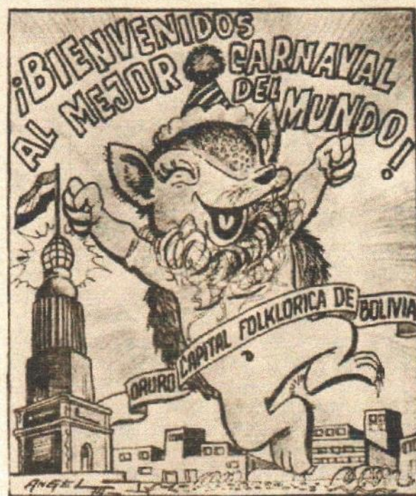
EL QUIRQUINCHO ANDINO ÍCONO EN EL FOLKLORE BOLIVIANO, IMÁGENES PUBLICADAS POR EL PERIÓDICO LA PATRIA DE ORURO EN LA DECADA DE LOS AÑOS DE 1950