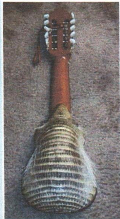
EL QUIRQUINCHO ANDINO ESPECIE ANIMAL VULNERABLE A LA EXTINCIÓN DE SU ESPECIE