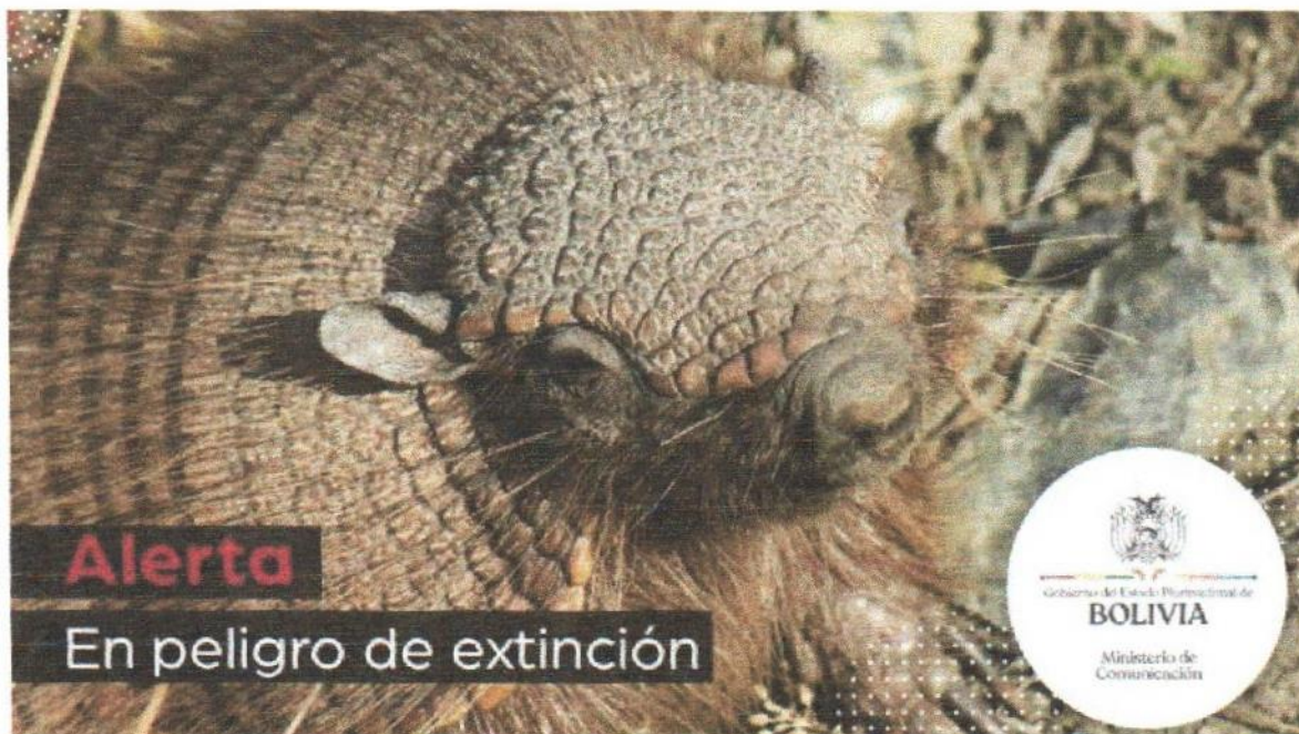
EL QUIRQUINCHO ANDINO EN PELIGRO DE EXTINCIÓN EN BOLIVIA

Esta situación es muy preocupante, actualmente no existen medidas de conservación concretas, el Ministerio de Medio Ambiente y Agua a través de la Dirección General de Biodiversidad y Áreas Protegidas (DGBAP) y la Policía Forestal y Medio Ambiente POFOMA realizan campañas para evitar el uso de animales silvestres en festividades, sin mucho impacto ya que se realiza este trabajo previo a estas festividades como el Carnaval de Oruro u otras festividades del país, en tal razón el objetivo del presente proyecto Ley Nacional "DECLÁRESE AL QUIRQUINCHO ANDINO PATRIMONIO NATURAL Y CULTURAL DEL ESTADO BOLIVIANO, Y CELÉBRESE EL 26 DE JULIO DE CADA AÑO "DÍA DEL QUIRQUINCHO ANDINO" ESPECIE AMENAZADA EN PELIGRO DE EXTINCIÓN EN EL ALTIPLANO BOLIVIANO" es buscar la preservación, protección y conservación de esta especie, símbolo e imagen del Altiplano Boliviano, para cuyo efecto deberán realizar la concientización, sensibilización y el desarrollo de campañas sobre el respeto a nuestra fauna silvestre.