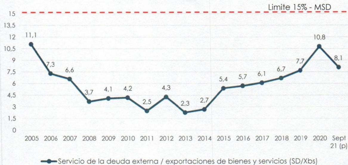
Gráfico N° 2 Servicio de la Deuda Externa / Exportaciones de Bienes y Servicios (En porcentaje)

"2022 AÑO DE LA REVOLUCIÓN CULTURAL PARA LA DESPATRIARCALIZACIÓN: POR UNA VIDA LIBRE DE VIOLENCIA CONTRA LAS MUJERES".