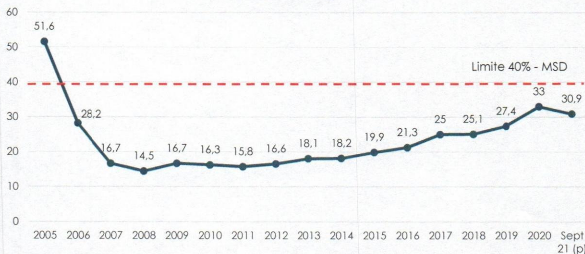
Gráfico N° 1 Saldo de Deuda Externa / PIB (En porcentaje)

p) preliminar según datos económicos del BCB