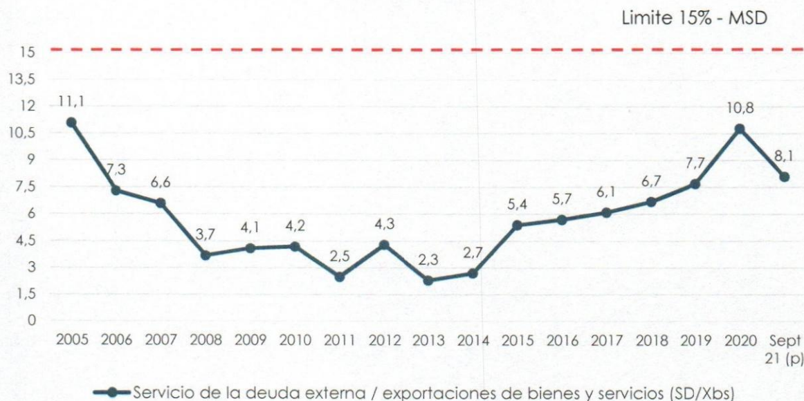
Gráfico N° 2 Servicio de la Deuda Externa / Exportaciones de Bienes y Servicios (En porcentaje)

p) preliminar según datos económicos del BCB