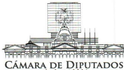
Dip. I. Renán Cabezas Veizan PRESIDENTE COMISION DE CONSTITUCION LEGISLACION Y SISTEMA ELECTORAL CAMARA DE DIPUTADOS Asamblea Legislativa Plurinacional

generen se regularán por la Ley, para atender prioritariamente a su conservación, preservación y promoción.” II. “El Estado garantizará el registro, protección, restauración, recuperación, revitalización, enriquecimiento, promoción y difusión de su patrimonio cultural, de acuerdo con la ley”.