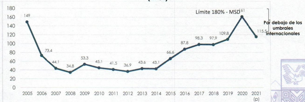
Gráfico N° 2 Indicador de Solvencia Saldo de Deuda Externa / Exportaciones de Bienes y Servicios (en%)

(* Exportación de bienes y servicios (p) preliminar MSD: Marco de Sostenibilidad de Deuda – MSD por el Banco Mundial – BM y el Fondo Monetario Internacional – FMI