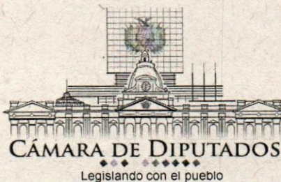
Héctor Arce Rodríguez DIPUTADO NACIONAL ASAMBLEA LEGISLATIVA PLURINACIONAL