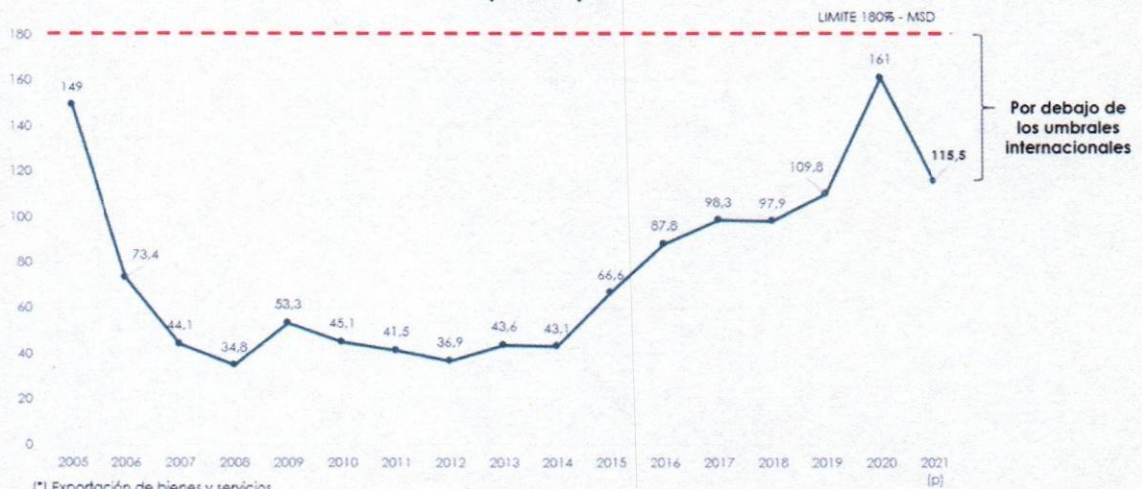
Gráfico N° 3 Saldo Deuda / Exportaciones* (en %)

(*) Exportación de bienes y servicios (p) preliminar MSD: Marco de Sostenibilidad de Deuda (MSD) por el Banco Mundial (BM) y el Fondo Monetario Internacional del (FMI)