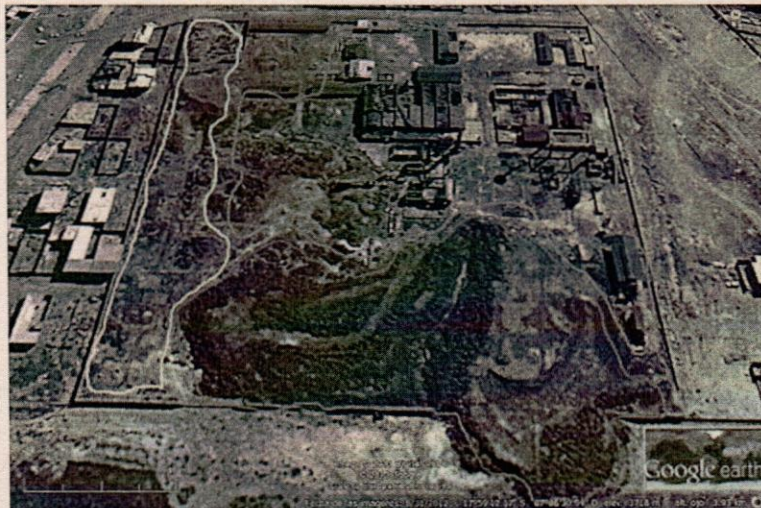
Figura 1: Categorización Predios de Fundición Ex-Metabol

En la figura 1 se muestra las áreas categorizadas con características similares.