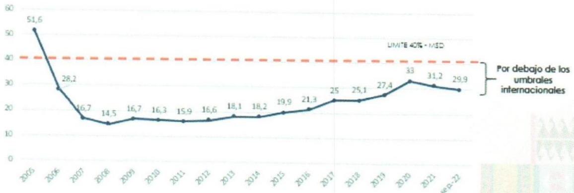
Gráfico N° 1 Indicador de Solvencia Saldo de Deuda / PIB (en %)

MSD: Marco de Sostenibilidad de Deuda (MSD) por el Banco Mundial (BM) y el Fondo Monetario Internacional (FMI)