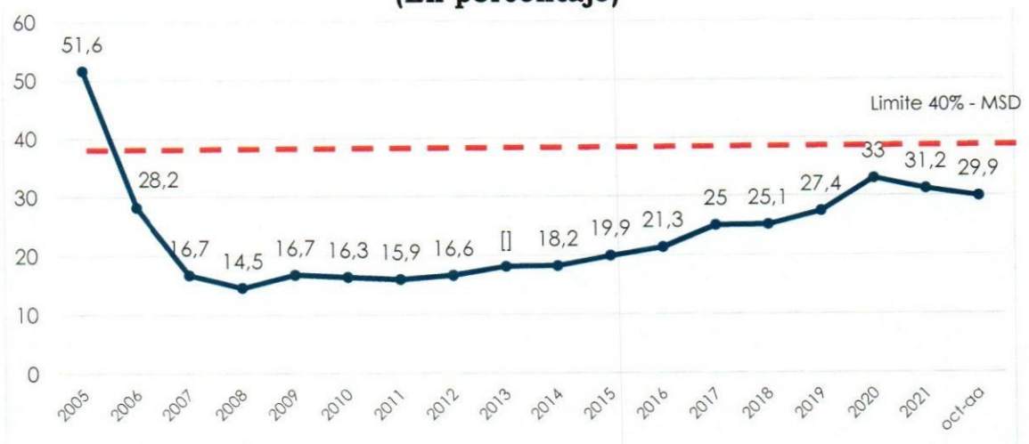
Gráfico N° 1 Saldo de Deuda Externa / PIB (En porcentaje)

(p) preliminar MSD: Marco de Sostenibilidad de Deuda – MSD por el Banco Mundial – BM y el Fondo Monetario Internacional – FMI