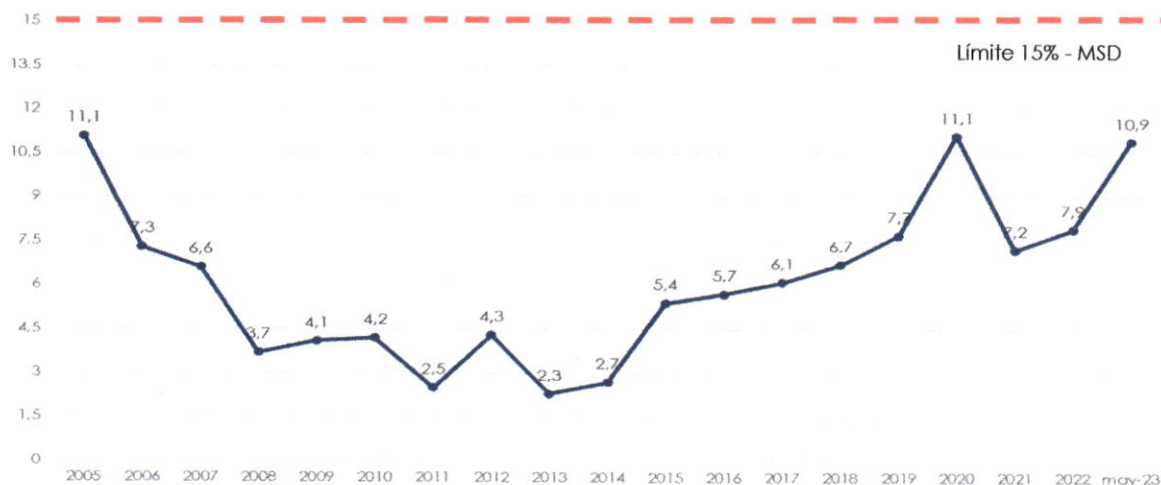
Gráfico N° 2 Servicio de la Deuda Externa / Exportaciones de Bienes y Servicios (En porcentaje)

que se encuentra por debajo del límite establecido en el MSD del BM y el FMI de 15%.