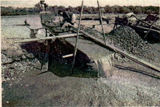
FIGURA 1. TESTIMONIO DE VERIFICACION DE CONTAMINACION POR USO DE MERCURIO

planta a partir del amoniaco que se producirá en Bulo-Bulo a partir del año 2017. La implementación de una planta de tiourea en territorio nacional permitirá que la Empresa Inti Raymi y otras empresas y/o cooperativas y empresas auríferas del país sustituyan totalmente el uso de cianuro y mercurio que actualmente utilizan y salvar vidas humanas.