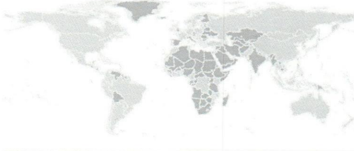
Gráfico 5.1 ■ Mundo: países con esquemas activos de ventanilla única de comercio exterior, 2014/2015

Nota: Los países sombreados en amarillo tienen esquemas activos de ventanilla única de comercio exterior.