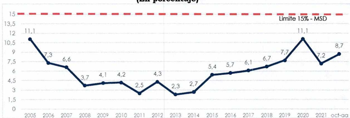
Gráfico N° 2 Servicio de la Deuda Externa / Exportaciones de Bienes y Servicios (En porcentaje)

MSD: Marco de Sostenibilidad de Deuda - MSD por el Banco Mundial - BM y el Fondo Monetario Internacional - FMI Fuente: BCB