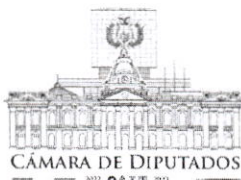
Carlos Alarcón Mondonio DIPUTADO NACIONAL ASAMBLEA LEGISLATIVA PLURINACIONAL - BOLIVIA

Sin otro particular, saludo a usted atentamente.