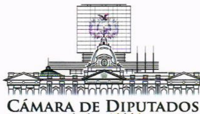
Dip. I. Renán Cabezas Verza PRESIDENTE COMISION DE CONSTITUCION LEGISLACION Y SISTEMA ELECTORAL CAMARA DE DIPUTADOS Asamblea Legislativa Plurinacional

generen se regularán por la Ley, para atender prioritariamente a su conservación, preservación y promoción.” II. “El Estado garantizará el registro, protección, restauración, recuperación, revitalización, enriquecimiento, promoción y difusión de su patrimonio cultural, de acuerdo con la ley”.