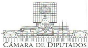
Keyla Ortiz Dorado DIPUTADA NACIONAL Asamblea Legislativa Plurinacional