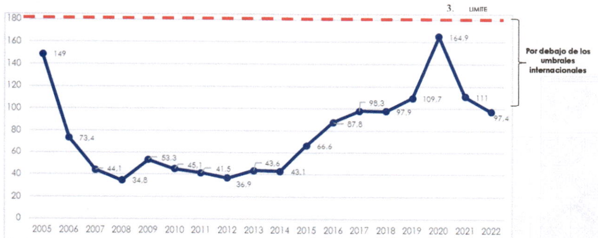
Gráfico N° 3 Saldo Deuda / Exportaciones (en %)

MSD: Marco de Sostenibilidad de Deuda elaborado por el BM y el FMI Fuente: BCB