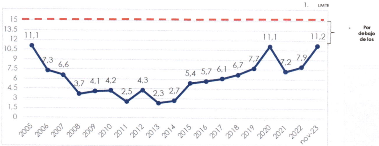
Gráfico N° 2 Indicador de Liquidez Servicio de Deuda / Exportaciones (en %)

MSD: Marco de Sostenibilidad de Deuda elaborado por el BM y el FMI Fuente: BCB