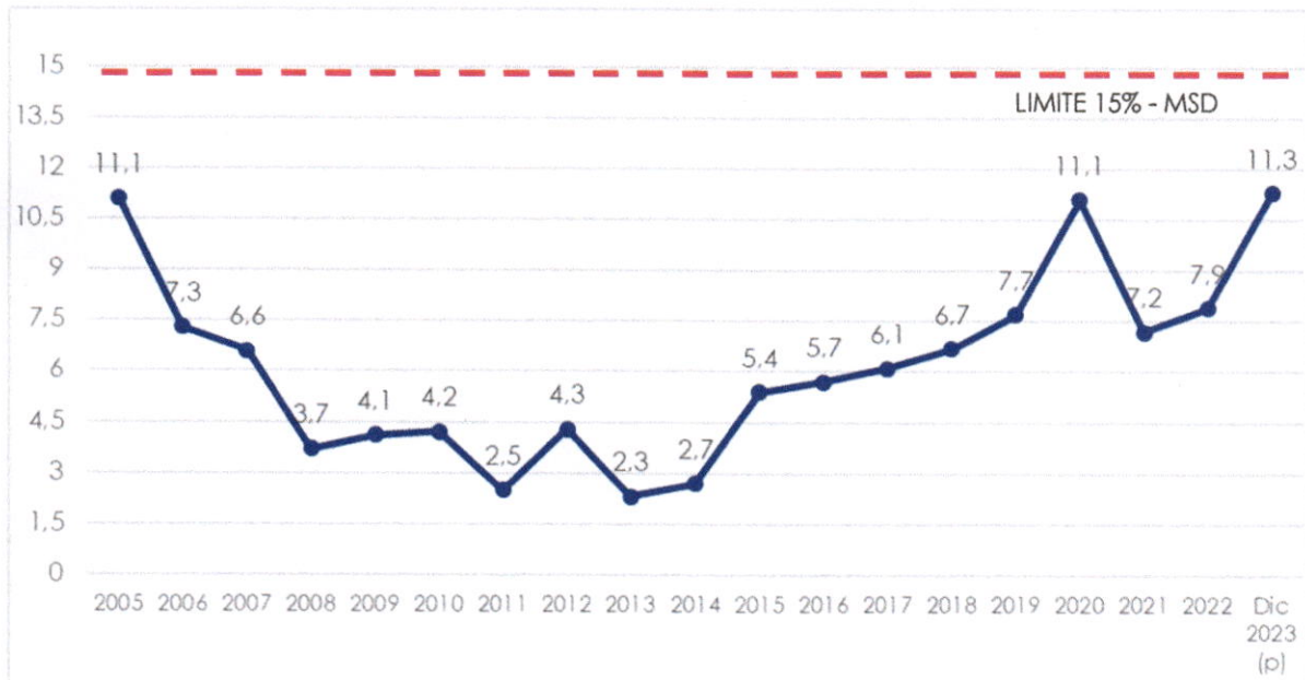
Gráfico N° 2 Servicio de la Deuda Externa / Exportaciones de Bienes y Servicios (En porcentaje)

(p) preliminar MSD por el BM y el FMI