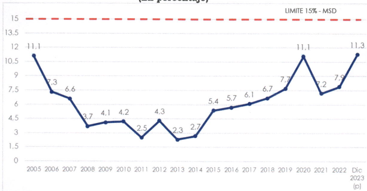
Gráfico N° 2 Servicio de la Deuda Externa / Exportaciones de Bienes y Servicios (En porcentaje)