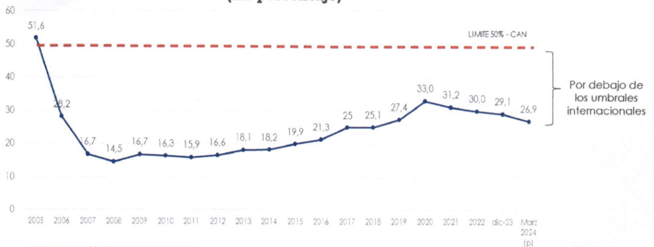
Gráfico N° 1 Saldo de Deuda Externa / PIB (En porcentaje)