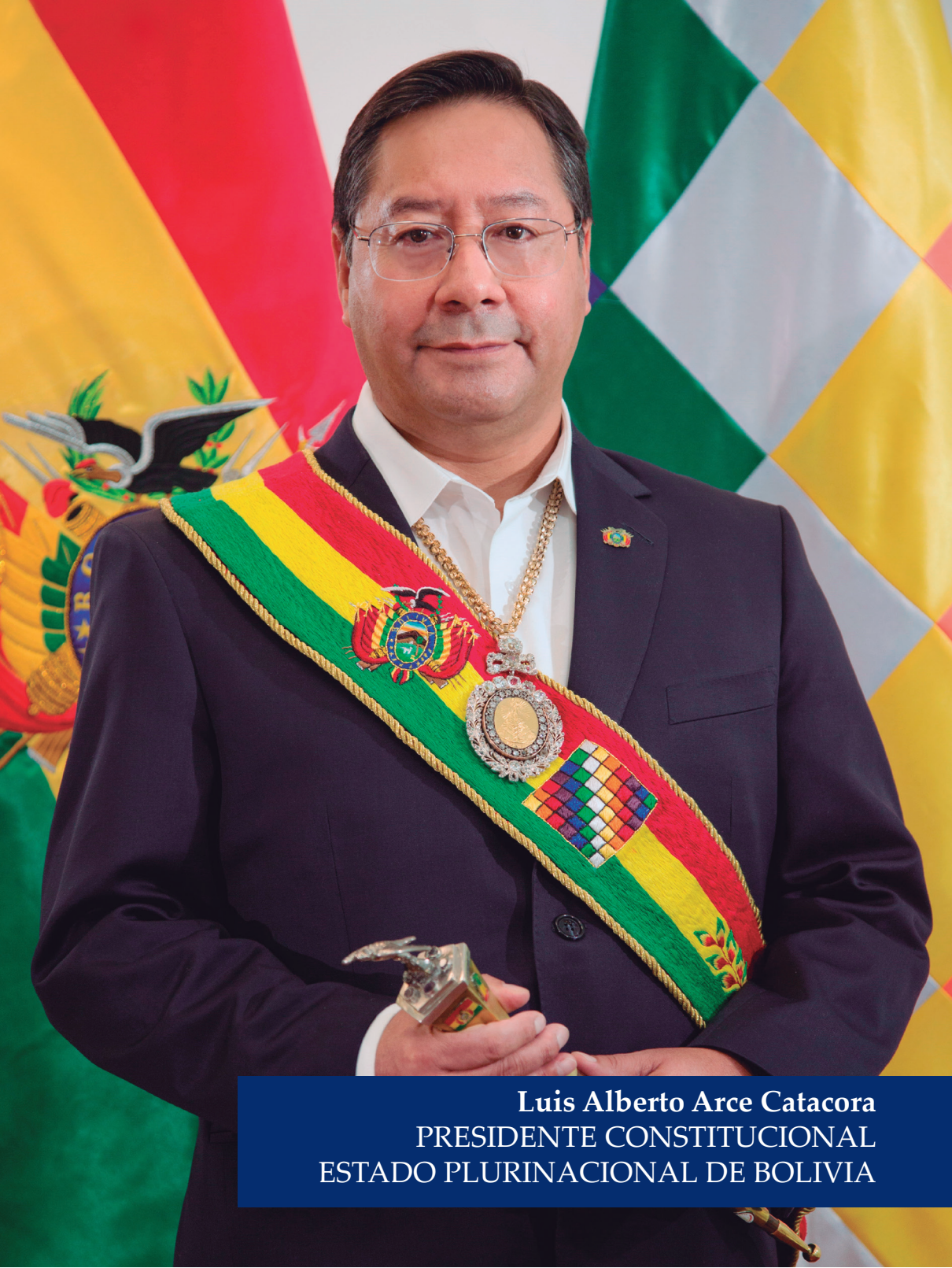
Luis Alberto Arce Catacora PRESIDENTE CONSTITUCIONAL ESTADO PLURINACIONAL DE BOLIVIA