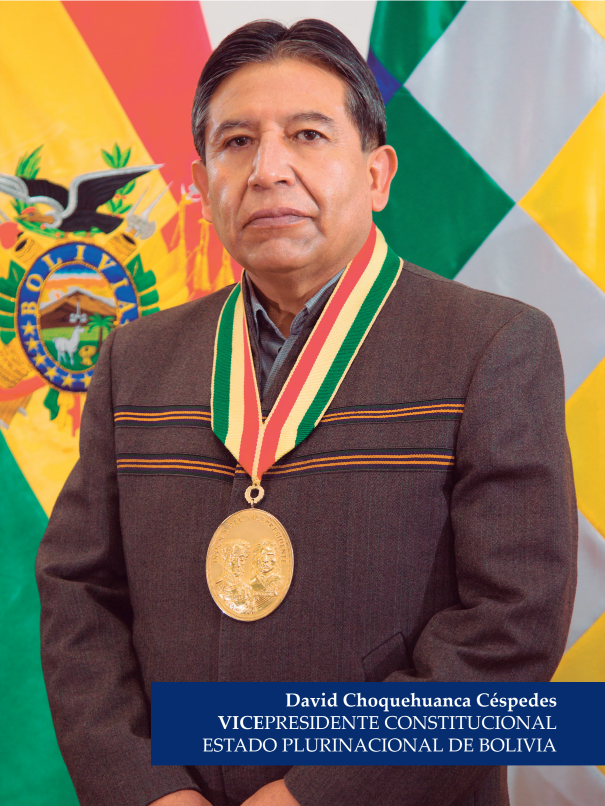
David Choquehuanca Céspedes VICEPRESIDENTE CONSTITUCIONAL ESTADO PLURINACIONAL DE BOLIVIA