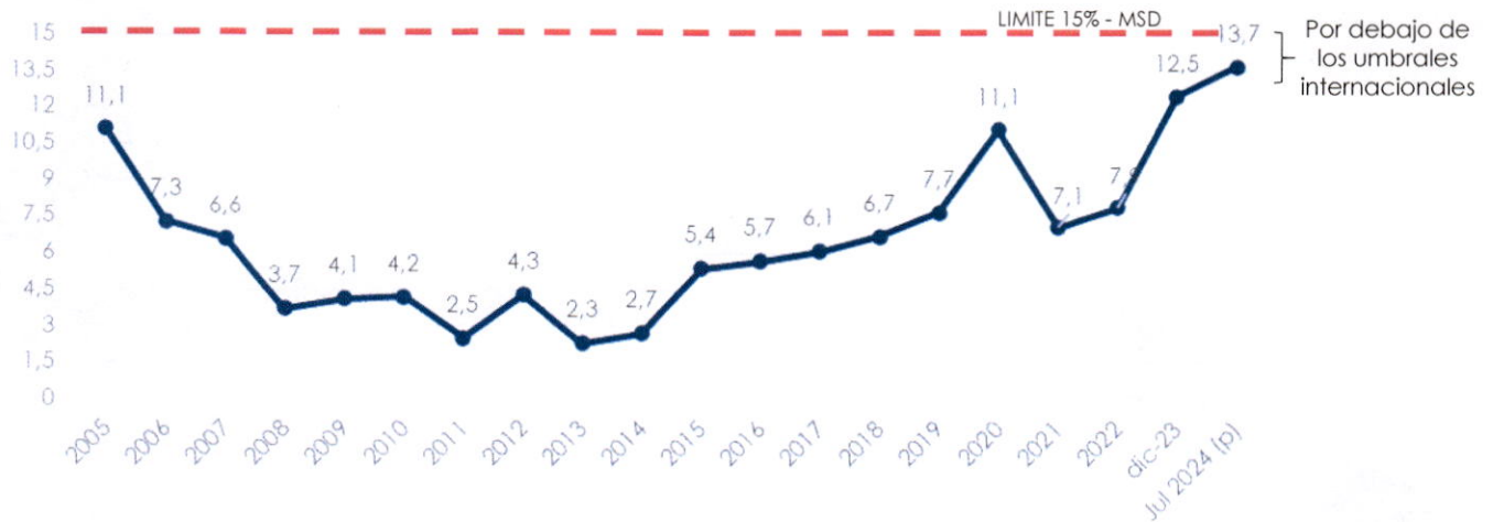
Gráfico N° 2 Indicador de Liquidez Servicio de Deuda / Exportaciones* (en %)

(*) Exportación de bienes y servicios MSD: MSD por el BM y el FMI