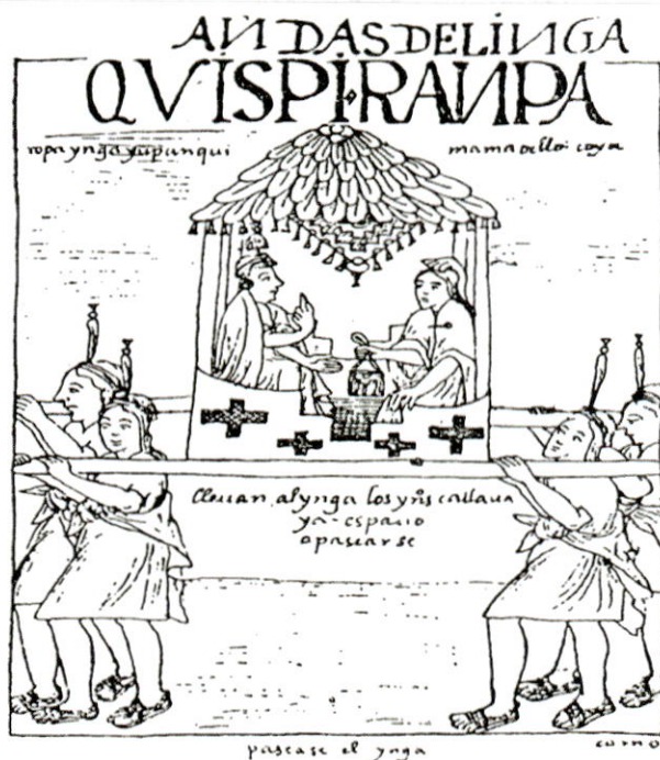
Fig. 1: Los Callauaya(s) / Kallawayas

De acuerdo a varios autores, esta región Kallawayá fue importante en cuanto al nexo geográfico en cuanto permitía el ingreso al territorio de los Chunchos. Al parecer esta región tenía el reconocimiento de “imperio del inca” puesto que además de servir de nexo brindaba al inca un servicio. Gisbert menciona que fueron los que llevaban en andas al inca, es decir, los que alzaban al inca sobre fachadas y troncos de madera.