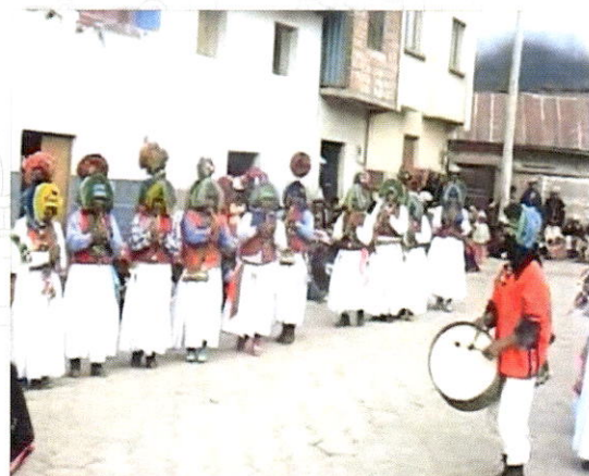
El conjunto de los Chatres del Ayllu Chacahuaya en la plaza principal de Amarete 2014.