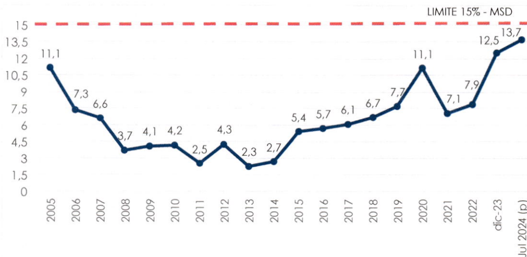
Gráfico N°2 Indicador de Liquidez Servicio de Deuda/Exportaciones* (En porcentaje)

Por debajo de los umbrales internacionales