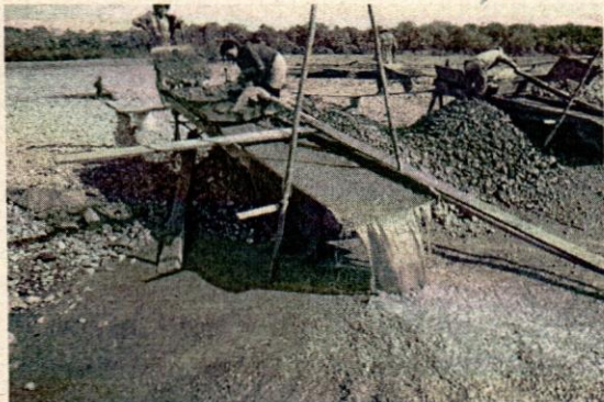
FIGURA 1. TESTIMONIO DE VERIFICACION DE CONTAMINACION POR USO DE MERCURIO

planta a partir del amoniaco que se producirá en Bulo-Bulo a partir del año 2017. La implementación de una planta de tiourea en territorio nacional permitirá que la Empresa Inti Raymi y otras empresas y/o cooperativas y empresas auríferas del país sustituyan totalmente el uso de cianuro y mercurio que actualmente utilizan y salvar vidas humanas.