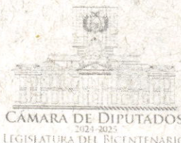
Santos Mamani Espinoza DIPUTADO NACIONAL ASAMBLEA LEGISLATIVA PLURINACIONAL

En Bolivia, con el concurso estatal estratégico y compartido propuesto estaríamos en condiciones de ofrecer una solución fáctica a una problemática actual que tiene sospechas de convertirse en una problemática de magnitudes medioambientales fatales para la sociedad boliviana, si no se toman medidas oportunas como el de la industrialización. Consiguientemente, se justifica el tratamiento de una Ley que materialice la gestión integral de residuos con la industrialización estatal, estratégica y compartida de los residuos.