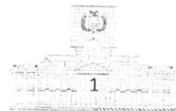
Carlos Alarcón Mondolito DIPUTADO NACIONAL ASAMBLEA LEGISLATIVA PLURINACIONAL - BOLIVIA

CÁMARA DE DIPUTADOS LEGISLATURA DEL BICENTENARIO