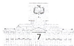
Carlos Alarcón Mondonio DIPUTADO NACIONAL ASAMBLEA LEGISLATIVA PLURINACIONAL - BOLIVIA